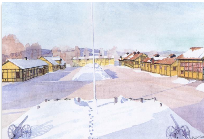
Akvarell Södra Kaserngården T 3 av Lars Holmer 1992